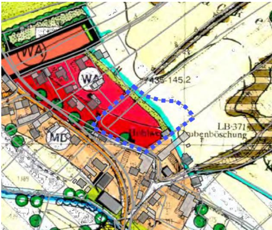
Abb. Auszug Flächennutzungsplan Ortsteil Geroldshausen vom 09.07.2015

Da es sich um die Aufhebung eines Bebauungsplans im beschleunigten Verfahren nach § 13a BauGB handelt, ist eine Änderung des Flächennutzungsplanes im Zuge des Verfahrens gemäß § 13a Abs. 2 Nr. 2 BauGB nicht erforderlich. Dieser wird im Wege der Berichtigung angepasst. Die Voraussetzungen sind gegeben, da die Aufhebung im Verfahren gemäß § 13a BauGB durchgeführt und die geordnete städtebauliche Entwicklung des Gemeindegebiets nicht beeinträchtigt wird.